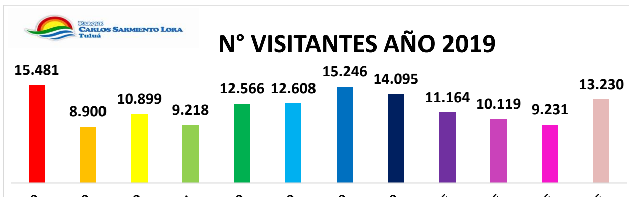
Gráfica 1. En esta gráfica se presenta el número de visitantes al Parque mes a mes durante el año 2019.

El Parque Carlos Sarmiento Lora, ofrece un oasis de bienestar y seguridad en el Corazón del Valle, siendo siempre sinónimo de alegría, sano disfrute, compromiso y solidaridad con todo el que nos visita. En el 2019, se obtuvo un registro de ingreso de personas correspondiente a 142.757, dentro de los cuales 85.655 fueron adultos y 57.102 niños.